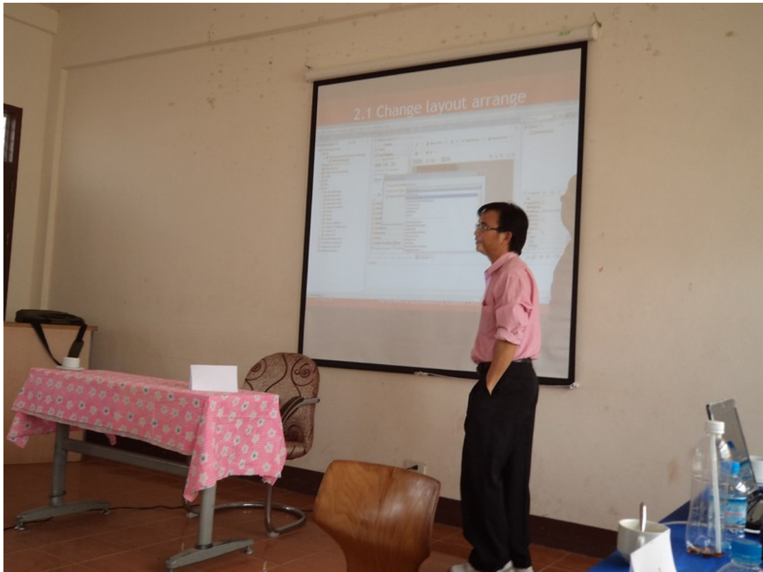
อบรมการเขียนโปรแกรมบนแอนดรอยด์

4.2.2 การเขียนเว็บโดยใช้ HTML 5 เป็นผลสืบเนื่องมาจากความเจริญก้าวหน้าด้านเทคโนโลยี และการเติบโตของอุปกรณ์พกพา ทำให้มีการพัฒนามาตรฐานใหม่ออกมาเพื่อให้รองรับการพัฒนาแอปพลิเคชันที่สามารถนำไปใช้งานบนอุปกรณ์พกพาได้ด้วย ซึ่งเรียกว่า HTML 5 ในเวอร์ชันนี้ได้เพิ่มแท็กที่สนับสนุนการทำงานด้านกราฟิก และโมบายมาด้วยทำให้นักพัฒนาทั้งหลายลดภาระบางอย่างลงไปมาก การพัฒนาแอปพลิเคชันทำได้สะดวกมากขึ้น