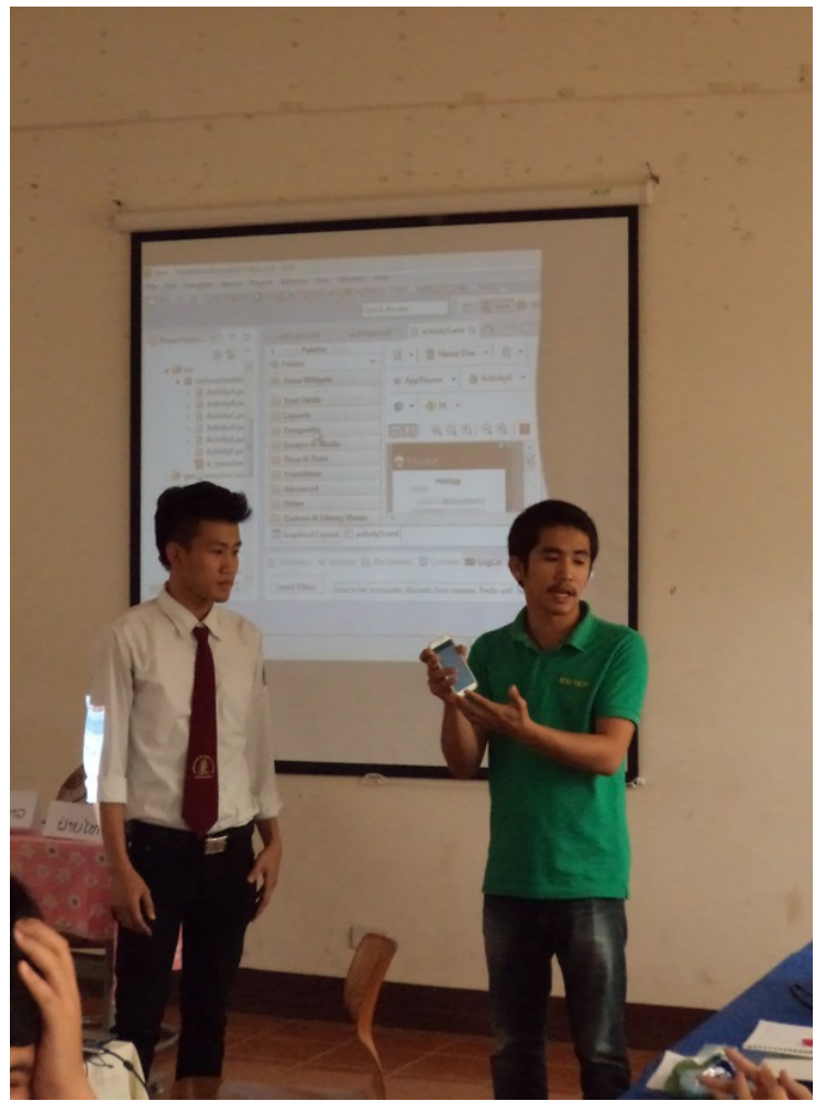
นักศึกษานำเสนอผลงาน