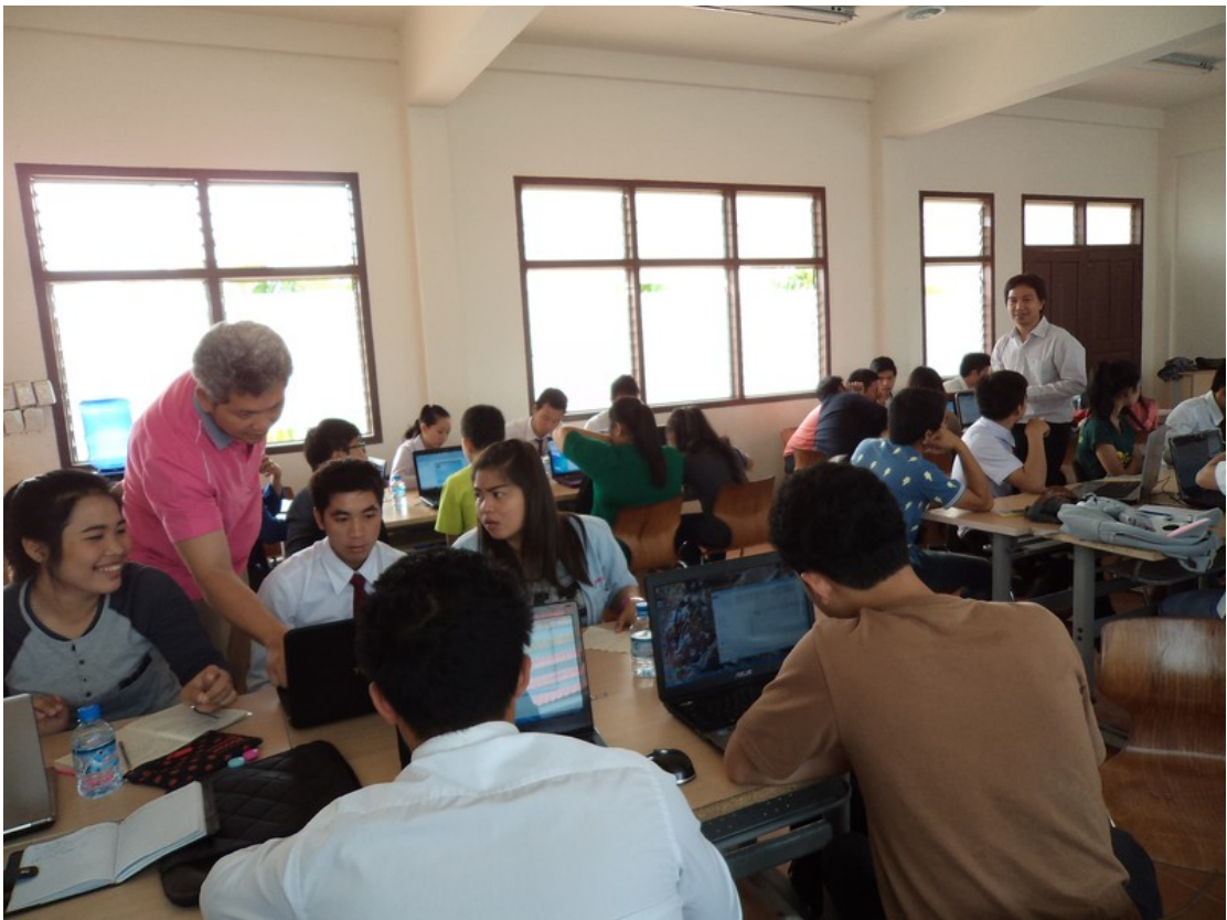
อบรมการเขียนเว็บโดยใช้ HTML 5