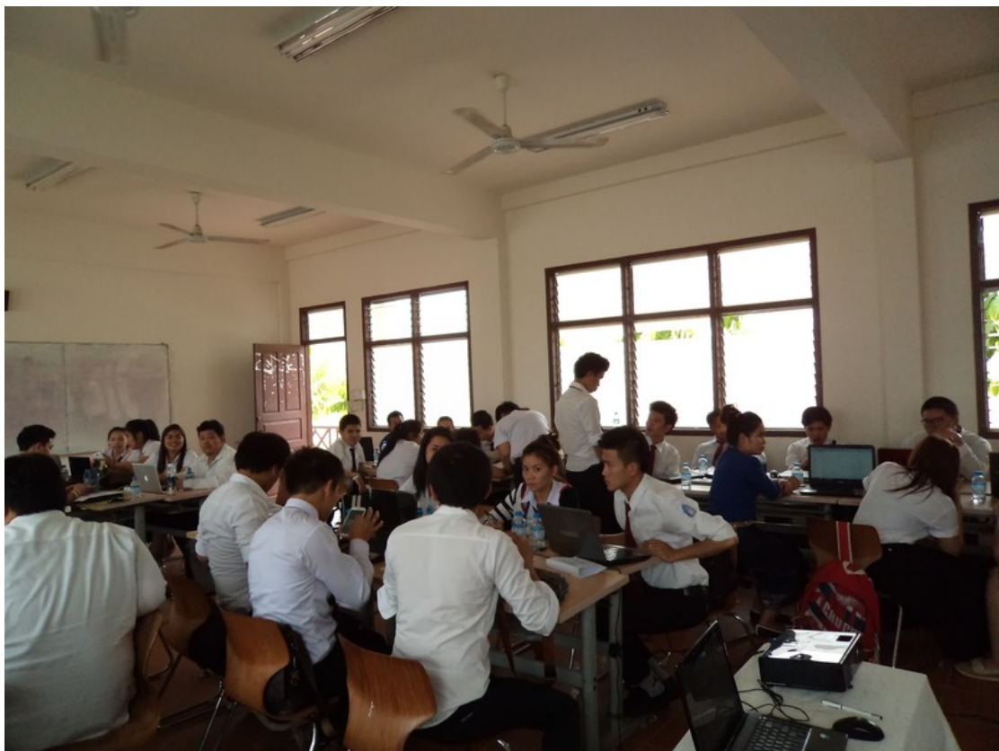
นักศึกษานั่งเรียนเป็นกลุ่ม

การจัดกิจกรรมครั้งนี้ถือเป็นการเตรียมความพร้อมในการก้าวสู่ประชาคมอาเซียน โดยการจัดครั้งนี้เป็นความร่วมมือของมหาวิทยาลัยราชภัฏนครปฐม ประเทศไทย กับมหาวิทยาลัยสุโขทัย ประเทศสาธารณรัฐประชาธิปไตยประชาชนลาว มีจุดมุ่งหมายเพื่ออบรมให้ความรู้แก่นักศึกษาและฝึกทักษะการทำงานร่วมกันเป็นทีมระหว่างนักศึกษาทั้งสองประเทศ ผลการจัดกิจกรรมครั้งนี้ของสรุปเป็นประเด็นดังนี้