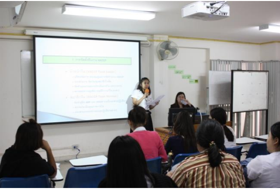
วิทยากรให้นักศึกษาทำกิจกรรมแล้วนำเสนองาน