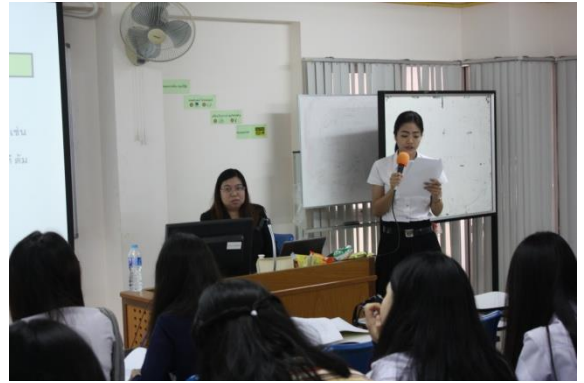
วิทยากรให้นักศึกษาทำกิจกรรมแล้วนำเสนองาน