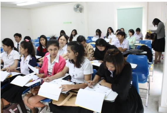
บรรยากาศการอบรม