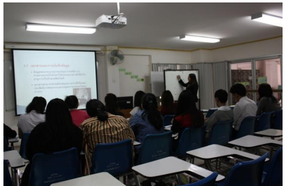
วิทยากรบรรยายเนื้อหาการอบรม