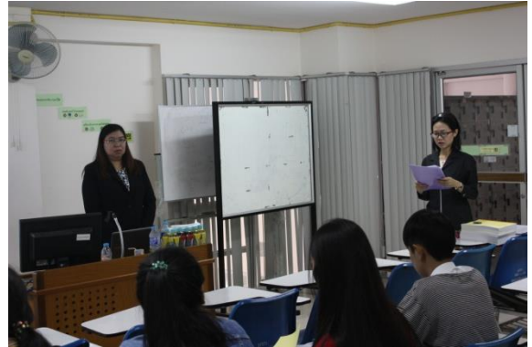
อาจารย์กล่าวเปิดโครงการอบรม