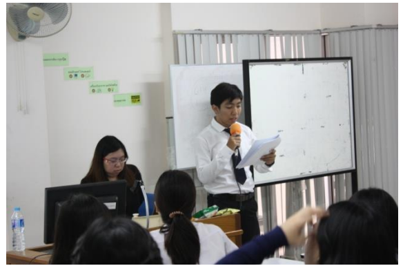
วิทยากรให้นักศึกษาทำกิจกรรมแล้วนำเสนองาน