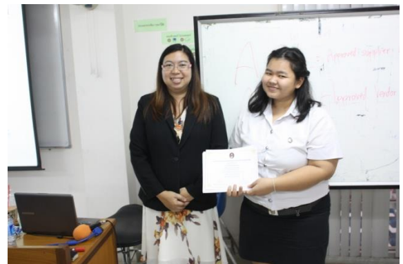
ตัวแทนนักศึกษารับใบประกาศนียบัตรในการอบรมครั้งนี้