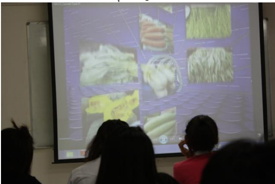
วิทยากรบรรยายเข้าสู่เนื้อหาการอบรม