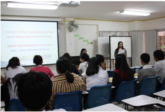
วิทยากรให้นักศึกษาทำกิจกรรมแล้วนำเสนองาน