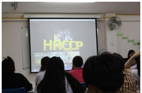
นักศึกษาตั้งใจต่อการอบรมครั้งนี้มาก